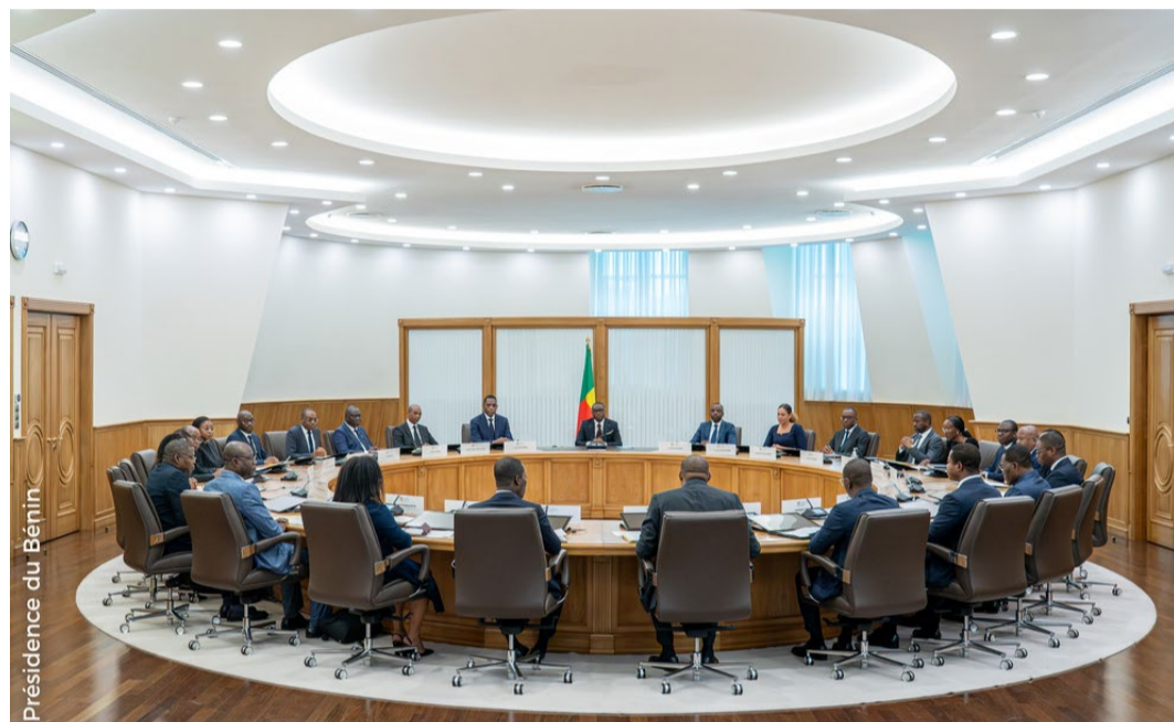
Présidence du Bénin

Le gouvernement béninois tient ce mercredi 1er juillet 2026 sa session mensuelle du Conseil des ministres sous la présidence du Chef de l'État. Plusieurs décisions importantes et des nominations sont attendues à l'issue des travaux.